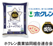
ホクレン農業協同組合連合会