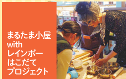
まるたま小屋 with レインボー はこだて プロジェクト