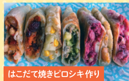
はこだて焼きピロシキ作り