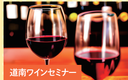
道南ワインセミナー

※出演者の変更となる場合がございます。※写真はイメージです。※車両を運転する方への酒類の提供は一切いたしません。