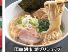
函館朝市 地ブリショップ