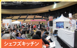
シェフズキッチン