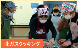
北ガスクッキング