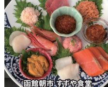
函館朝市 すずや食堂